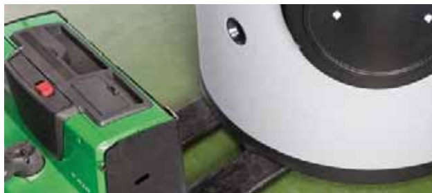
SISTEMA DE TRANSPORTE: Aberturas/conductos bajo el depósito para facilitar la manipulación con transpaletas (a partir de 1.500 litros).

Además disponen de cáncamos de elevación en la parte superior, para el caso de necesidad de ubicación del depósito en zonas elevadas y tener que ser izado con pluma de carga.